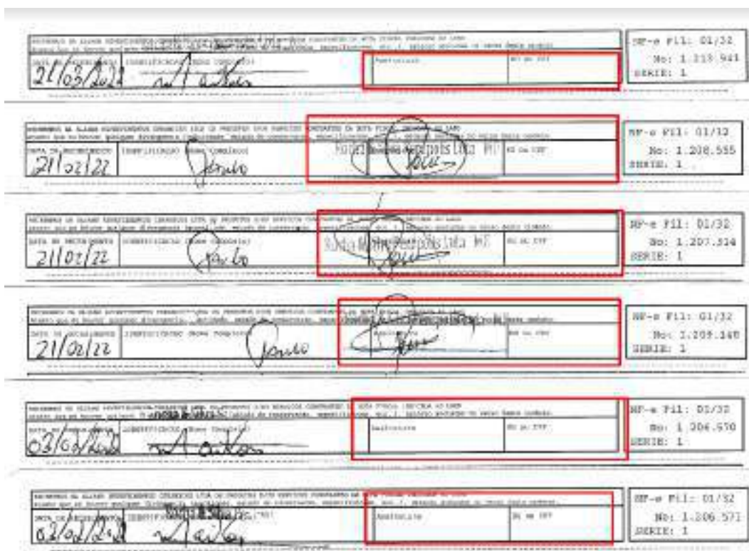
(Trechos extraído do doc. enviado pelas Credoras)

6. Não obstante, conforme pontuado anteriormente, diante da ausência de comprovante de entrega de todas as duplicatas, a Administradora Judicial diligenciou administrativamente junto às Credoras visando a obtenção dos documentos, todavia, não obteve retorno. Confira-se: