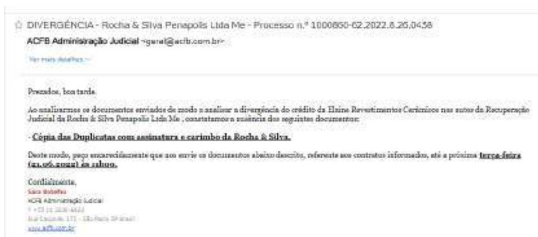
(trecho extraído do e-mail enviado às credoras)

6. Não obstante, conforme pontuado anteriormente, diante da ausência de comprovante de entrega de todas as duplicatas, a Administradora Judicial diligenciou administrativamente junto às Credoras visando a obtenção dos documentos, todavia, não obteve retorno. Confira-se: