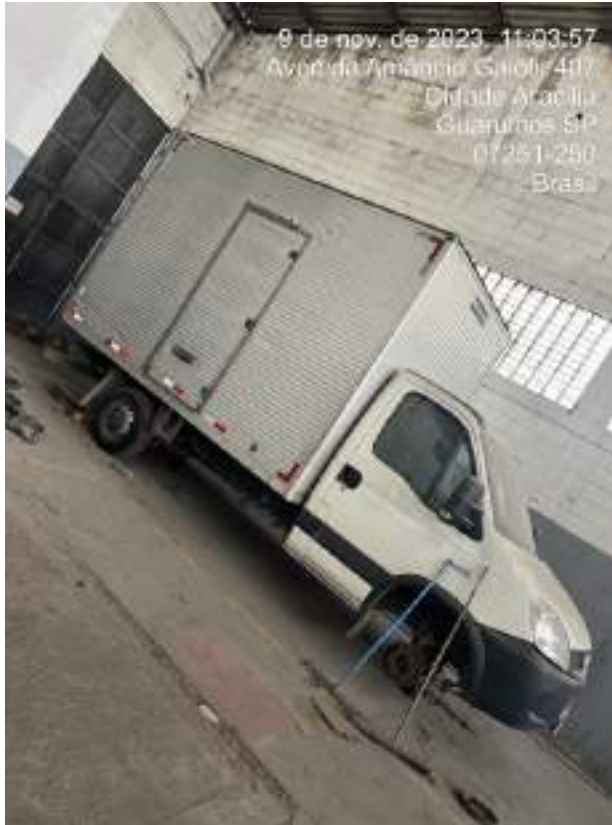
Imagem 8: Caminhão IVECO - FGR-7358