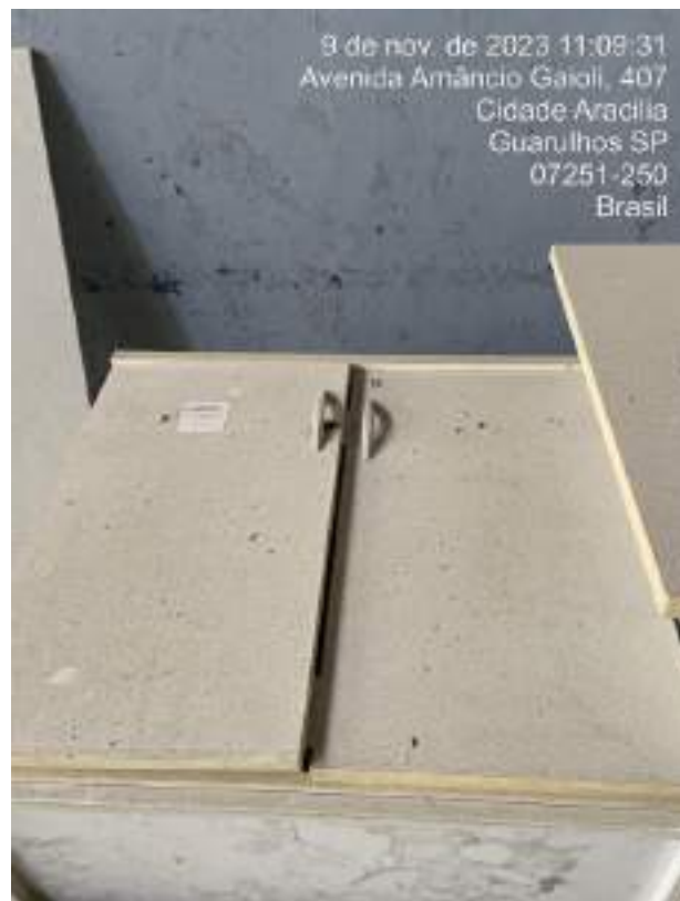
Imagem 15: Armário de Escritório com 02 portas