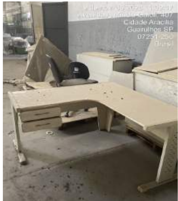
Imagem 23: Mesa de Escritório em L