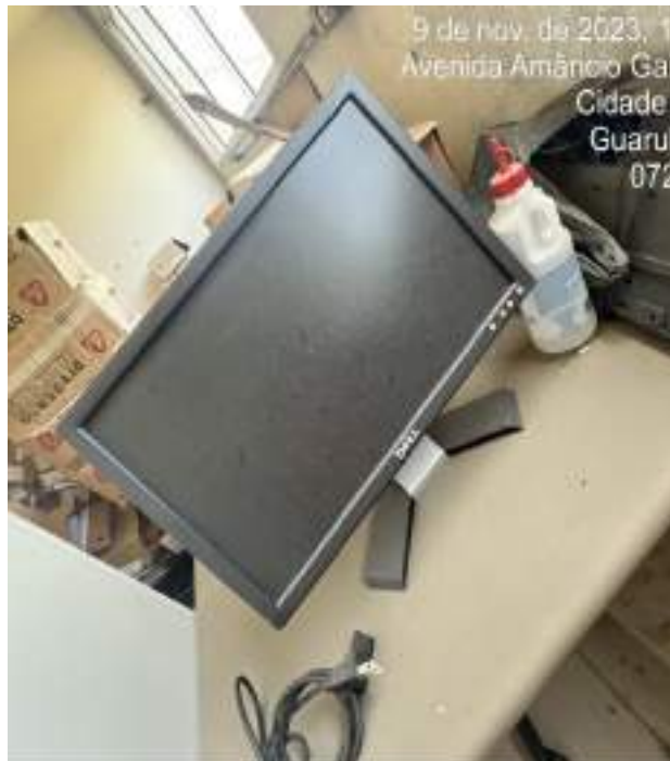
Imagem 22: Monitor Dell