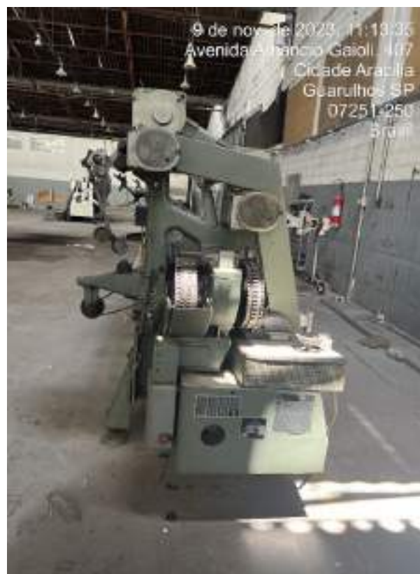
Imagem 7: KETTENSTHULL HKS 2 3 2 BARRAS 170 (KARL MAYER)