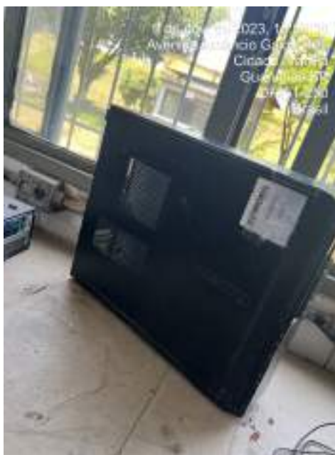
Imagem 4: Dell Vostro 230