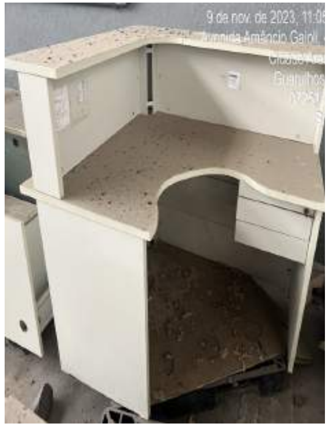
Imagem 11: Estação de Trabalho