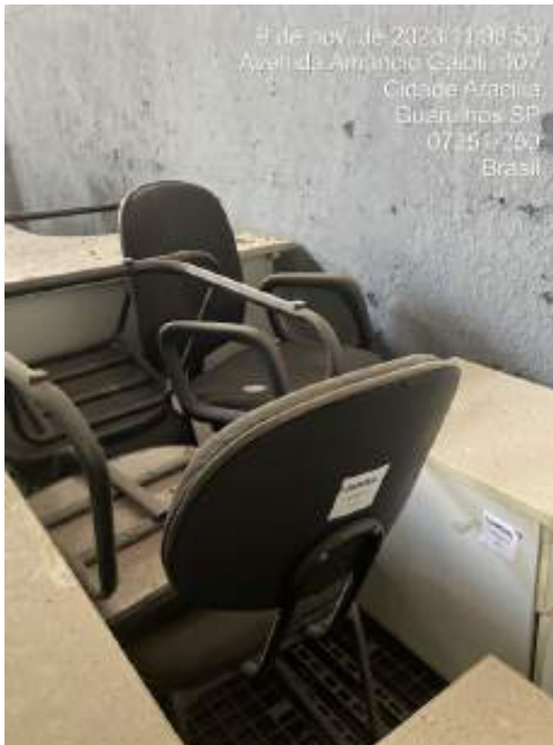
Imagem 10: Cadeiras de Escritório