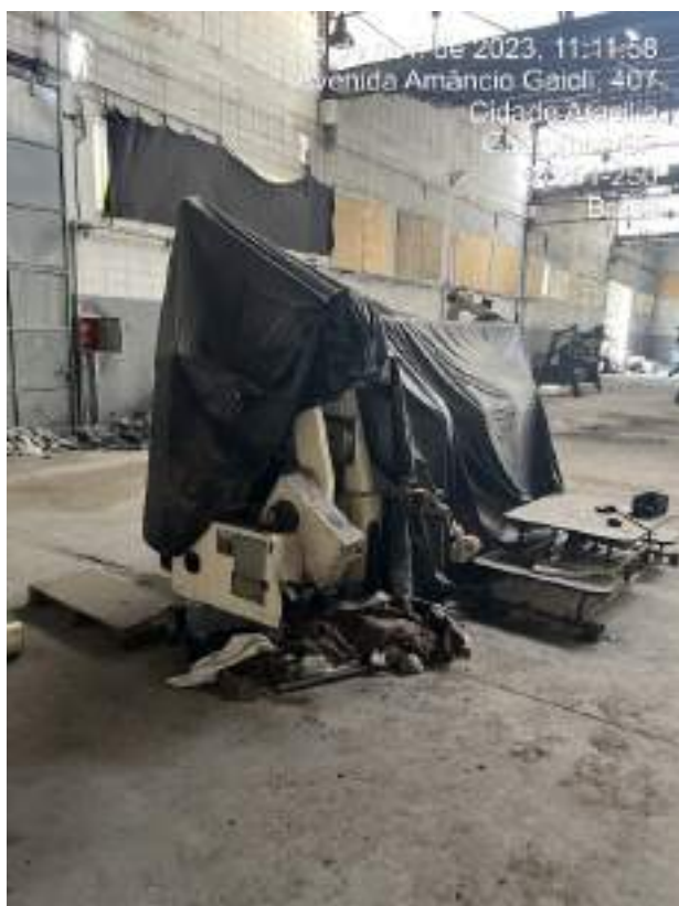
Imagem 6: KETTENSTHULL HKS 2 3 BARRAS 084 (KARL MAYER)