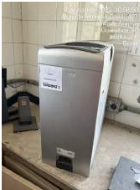
Imagem 2: Processador Pentium