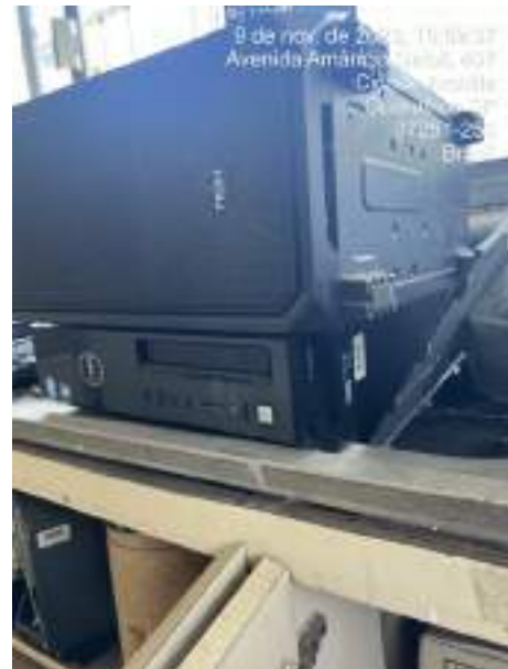
Imagem 3: Dell Vostro 220