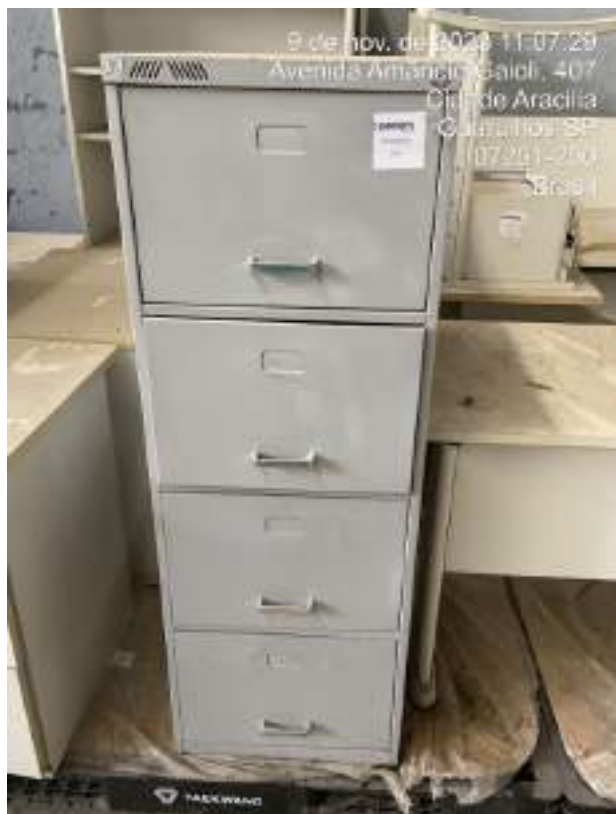
Imagem 14: Armário com 04 gavetas