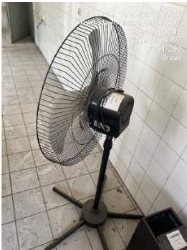
Imagem 12: Ventilador de Chão