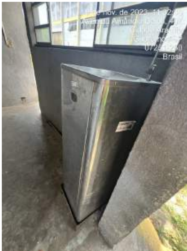
Imagem 13: bebedouro