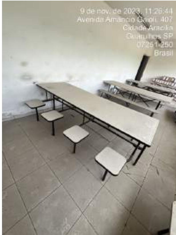
Imagem 20: Meses de refeitório