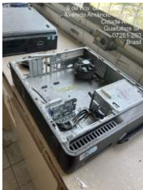
Imagem 5: Dell Vostro 260