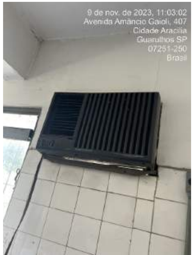
Imagem 19: Condensadora Consul