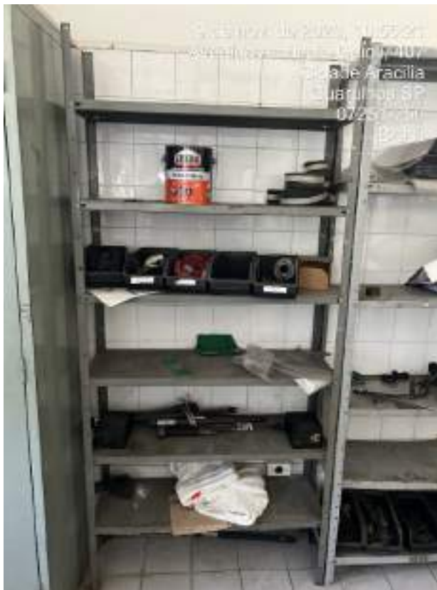
Imagem 18: Estante de ferro com 05 prateleiras