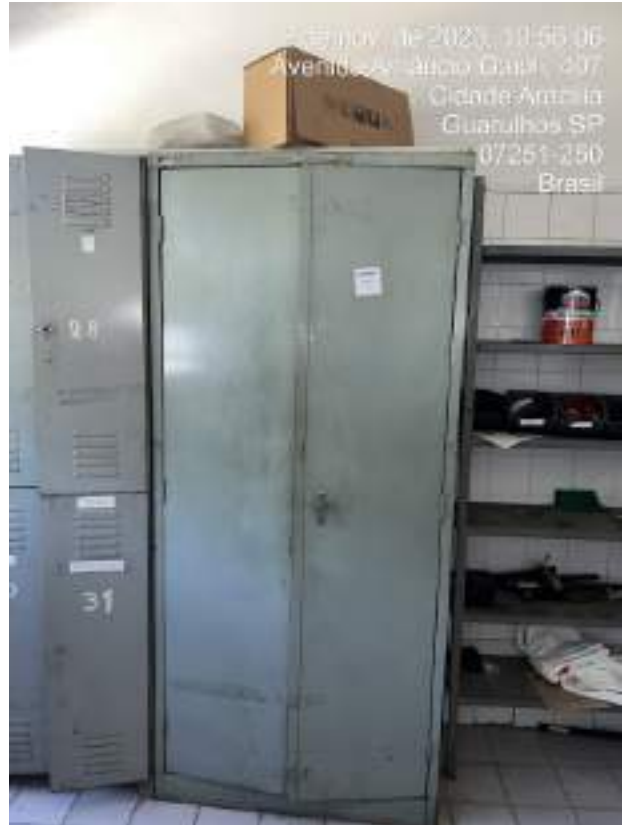
Imagem 9: Armário de Ferro