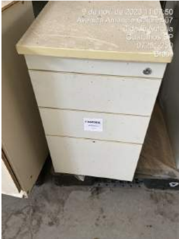
Imagem 16: Armário de Escritório com 03 gavetas