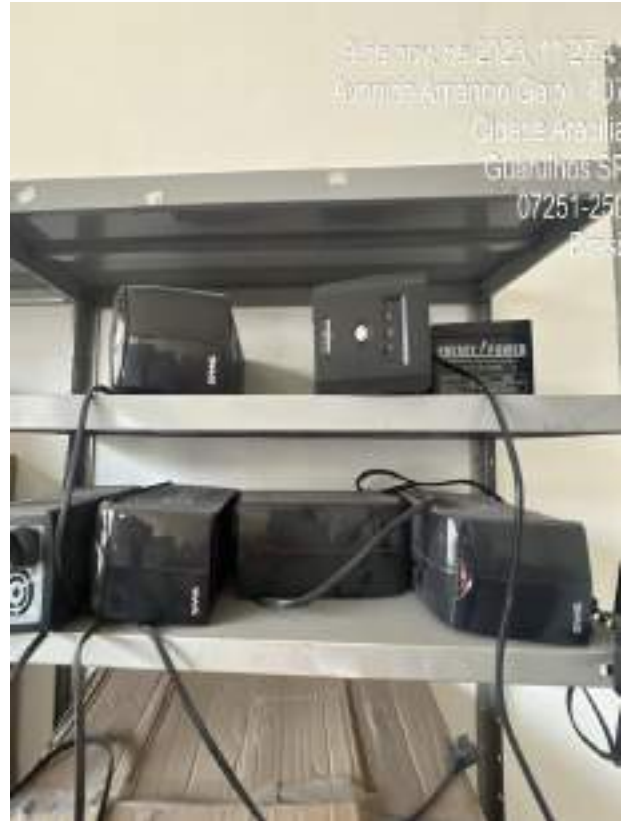
Imagem 21: telefone preto